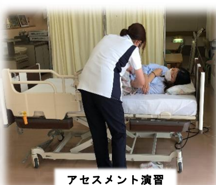
アセスメント演習