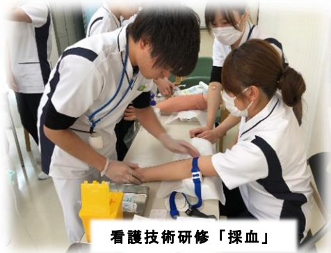
看護技術研修「採血」